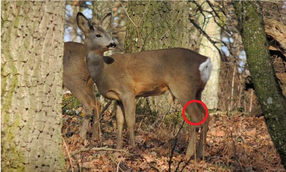
Afbeelding 3: Vlak boven het enkelgewricht wordt een snede gemaakt in de huid tussen het scheenbeen en de achillespees.