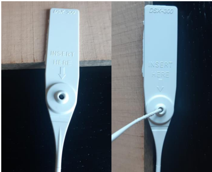
Afbeelding 2: Het wildmerk wordt gesloten door het uiteinde van de staart aan de achterkant door het gat te duwen en strak aan te trekken. Bij het gat staat de tekst INSERT HERE

Als het wildmerk is gesloten, wordt de staart niet afgeknipt. Alleen intacte wildmerken worden bij een eventuele controle geaccepteerd.